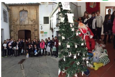
Solidarios: Hospital de Santiago