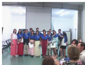
Acto Imposición de Becas Final de Etapa