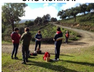
Recogida de setas en Tentudía

Para llevar a cabo este Proyecto contamos con un Claustro en formación continua, estable, ilusionado con la educación y comprometido con el Proyecto Educativo. Si queréis conocer más sobre nosotros, nos gustaría que nos acompañaseis durante una jornada de PUERTAS ABIERTAS: